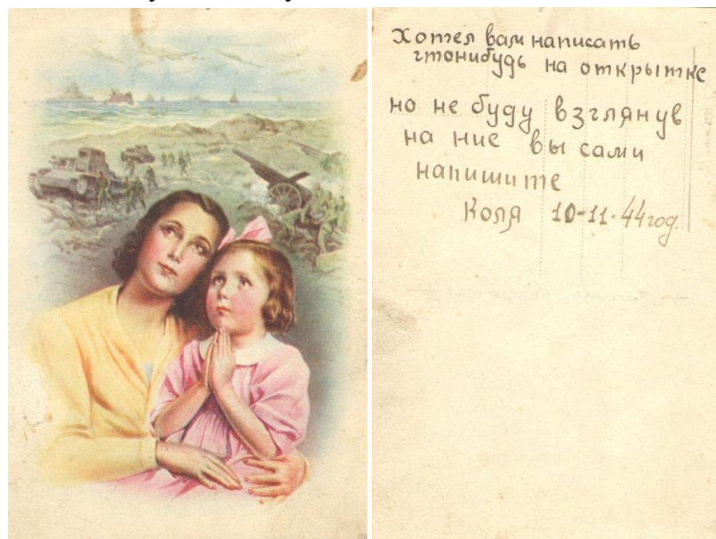
Рисунок 3 – Открытка с фронта

«Противник непрерывно контратаковал. Полки нашей дивизии постоянно перебрасывались для отражения контратак. А тут еще осенняя распутица, холода, трудности подвоза боеприпасов и горючего. Войска 46 армии готовились к форсированию реки Дунай южнее Будапешта в направлении острова Чепель, деревни Эрчи. 1 декабря 1944 года получен боевой приказ». 14