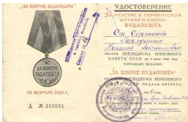
Рисунок 4 - Удостоверение на медаль «За взятие Будапешта»

Благодаря его смелости и находчивости пулеметные гнезда были уничтожены, и батарея получила возможность развернуться и вести огонь, расчищая путь пехоте. 31 декабря 1944 г. немцы контратаковали наши части и, потеснив их, подошли вплотную к орудиям прямой наводки, угрожая их взять. Старший сержант Горлушкин, получив приказание прикрыть фланги обороны силами отделения разведки, успешно и с честью выполнил это задание и удержал рубеж до подхода подкрепления. Организованным ружейным и пулеметным огнем он отражал все контратаки немцев и лично убил двух немецких автоматчиков. 16