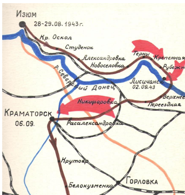
Рисунок 1 – Схема расположения боевых позиций →

За ночь надо было оборудовать наблюдательный пункт. Грунт был каменистым, работа шла не очень споро. К утру оборудовали землянку, а уже днем немцы проверили ее на прочность. И тогда они поняли, что в ней будет не очень «уютно» во время артобстрела. Зато в следующую ночь никого не пришлось убеждать, оборудовали такие укрытия, что никакие артобстрелы и бомбежки не страшны. 1