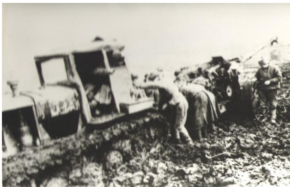
Фото 7 - Техника не справлялась, а люди могли все